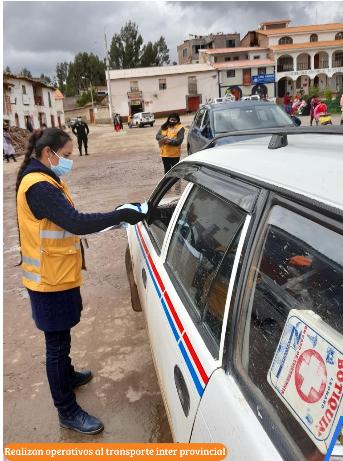
Realizan operativos al transporte inter provincial

Con estas acciones realizadas se busca dar confianza a los turistas al momento de elegir la empresa de transporte que cumpla con los protocolos de bioseguridad y porte con la documentación en regla.